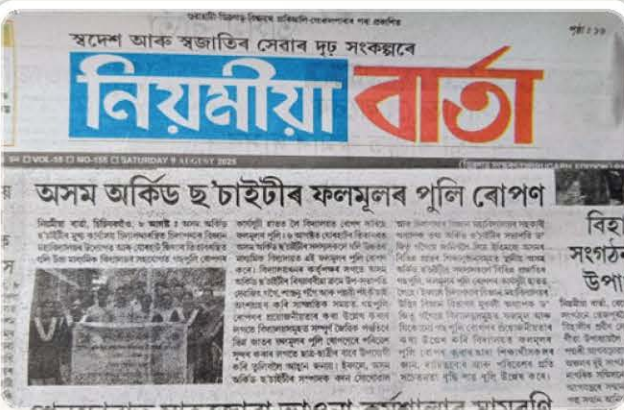
Society News Achievement.