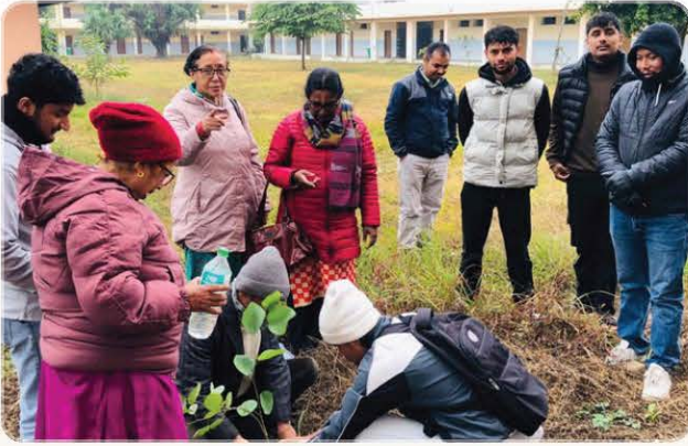
Plantation Programme in Nepal.