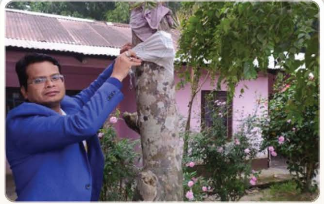
Society members enjoying a meaningful activity segment.