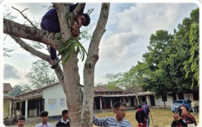
Orchid plantation activity in Digboi.