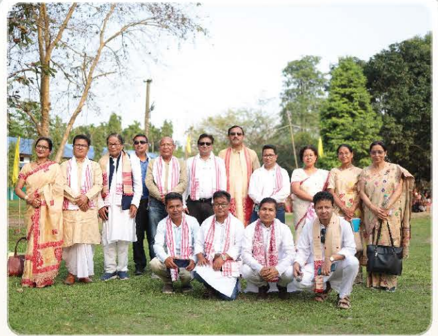
Commemorative group photograph.