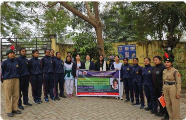
Campaigning at Nowgong Girls' College.