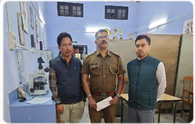
Kakopathar Police support an orchid rescue coordination visit.