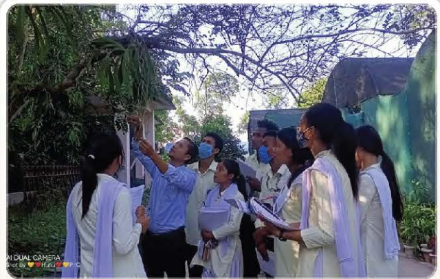
Outdoor orchid awareness session with students.