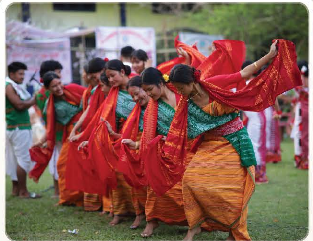
Traditional dance at Orchid Festival 2025.