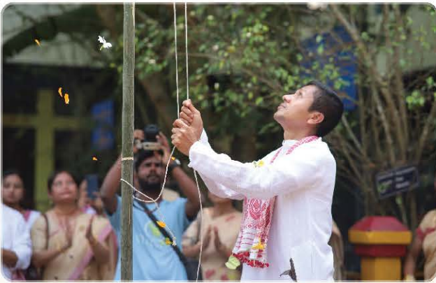
Flag Hoisting in Orchid Festival 2025 by the Society President.