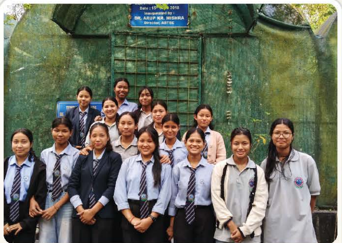
Student members gather for a plantation-day group portrait.