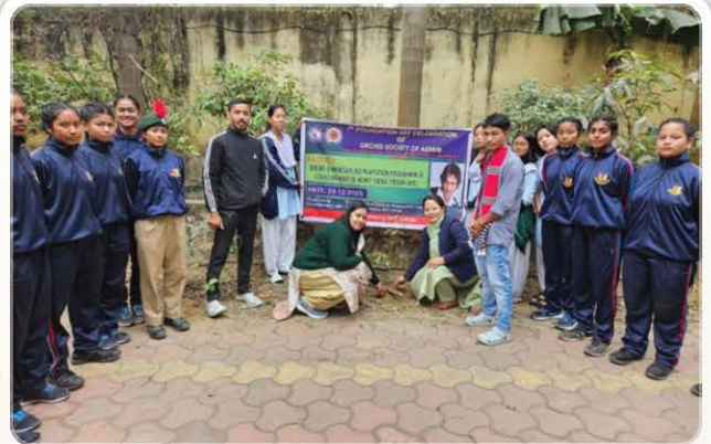
Awareness campaigning in Nowgong Girls' College.