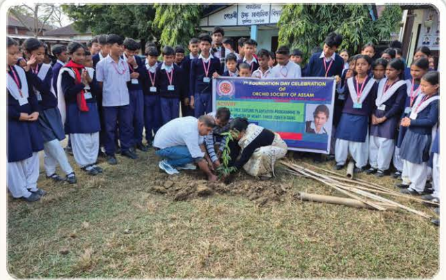
Plantation drive with student participation.