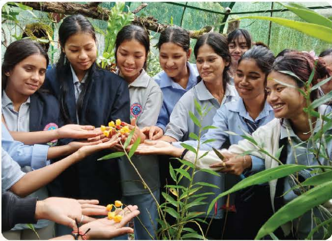
Student members admire orchid blooms together.