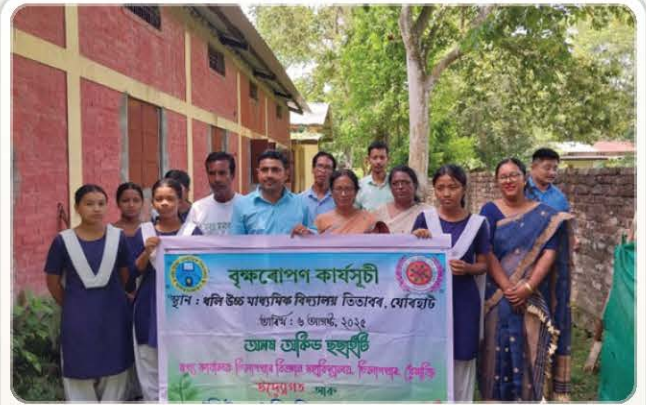
A meaningful activity moment from the society archive.