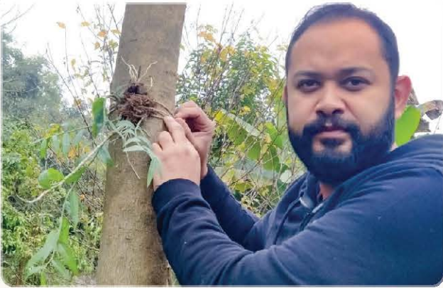
Society Member Planting Orchid.