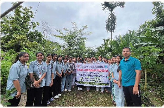
Participants with the programme banner.