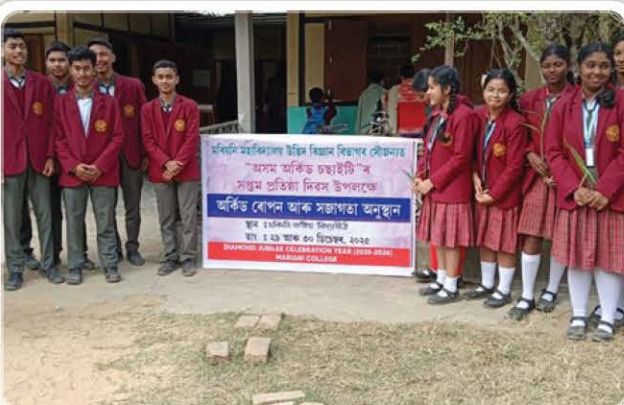
Students with the event banner.