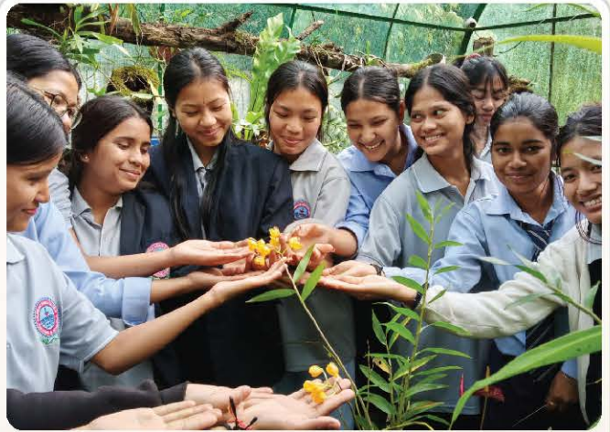
Students gather around orchids during the plantation visit.