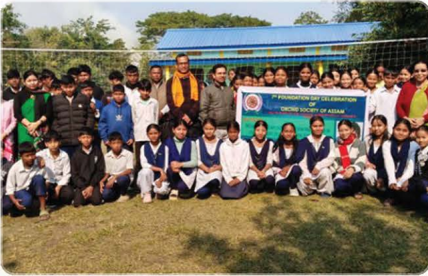
Group photo with the green event banner.