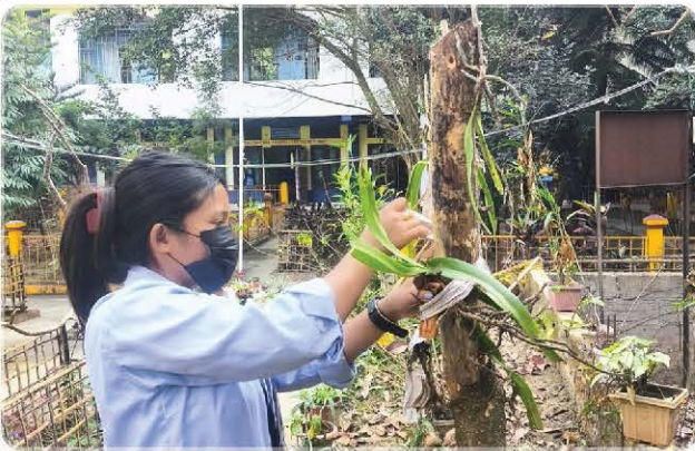
A student Planting Orchid.