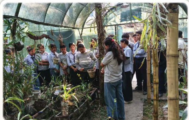
Hands-on orchid conservation demonstration in the orchid house.