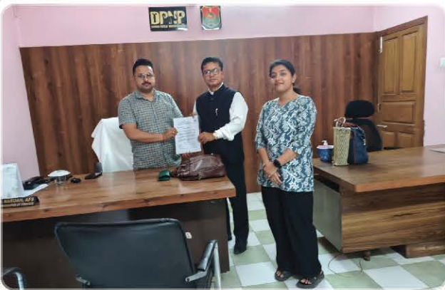
Forest department outreach for orchid rescue and awareness.