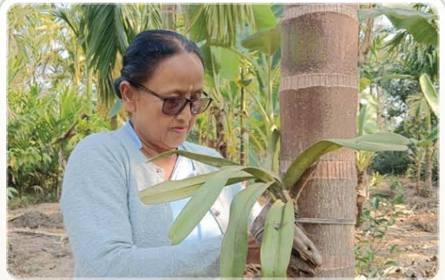
A Society Member Caring an Orchid.