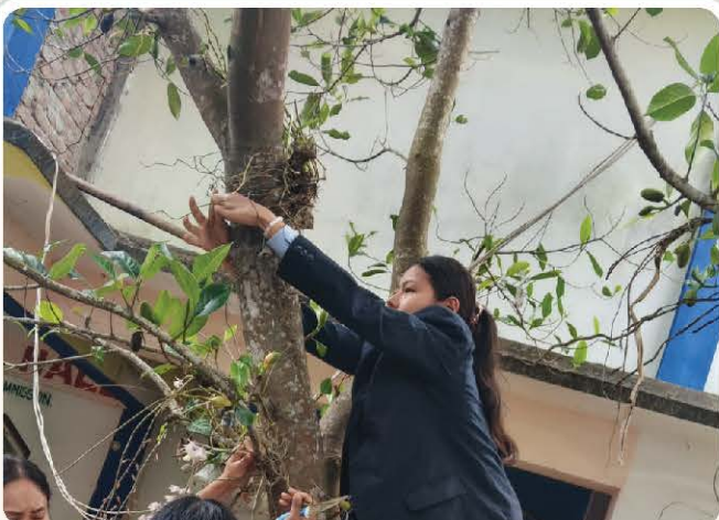
Students mount orchids carefully on a host tree.