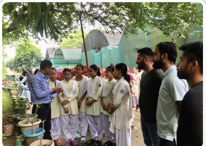
A plantation briefing guides student members through the visit.