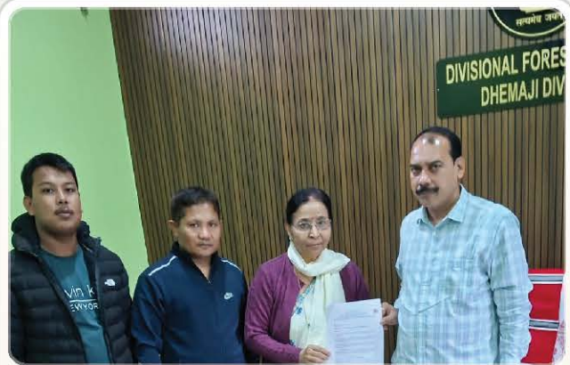
Representation submitted at Dhemaji Divisional Forest Office.