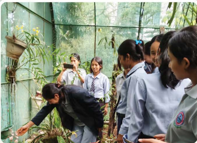
Student members learn orchid care in the orchid house.