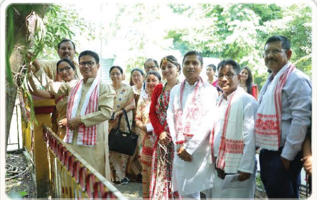
A Sweet moment of Orchid Plantation.