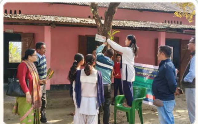
Demonstration beside the event banner.