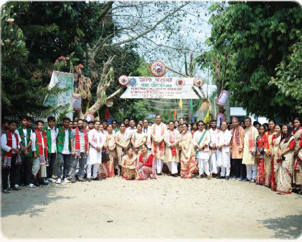
Group photo at the festival entrance.

Selected glimpses of participation, fellowship, and memorable moments from the Society's programmes.