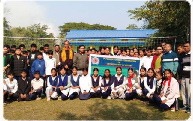
Participants gathered with the programme banner.