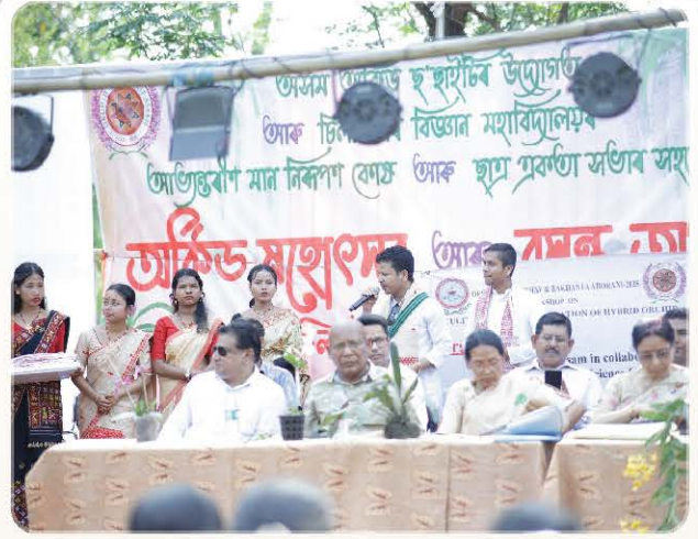
Guests and organisers on stage.