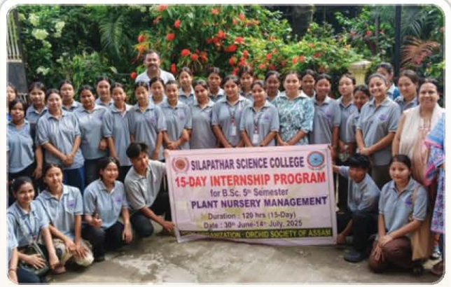
Internship Programme on Plant Nursery Management.