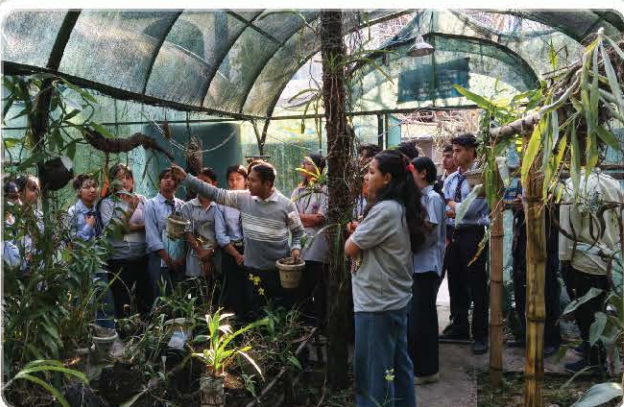
Students observe orchid specimens in a guided demonstration.