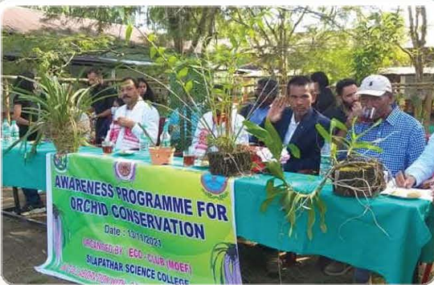
Orchid conservation awareness at Silapathar Science College.