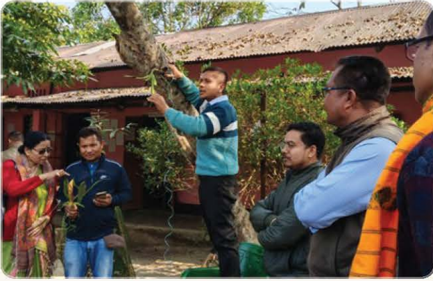
Orchid Plantation Programme in Dhemaji.