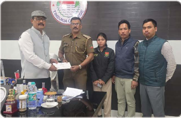
Tinsukia College principal joins orchid conservation outreach.