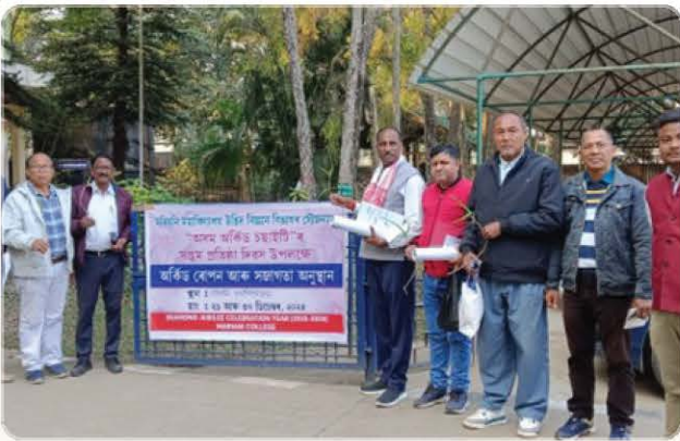
Foundation day Celebration Mariani College