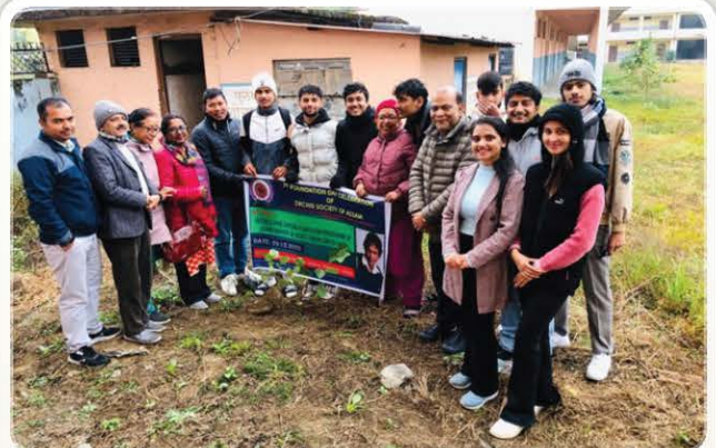
Foundation Day Observed in Nepal