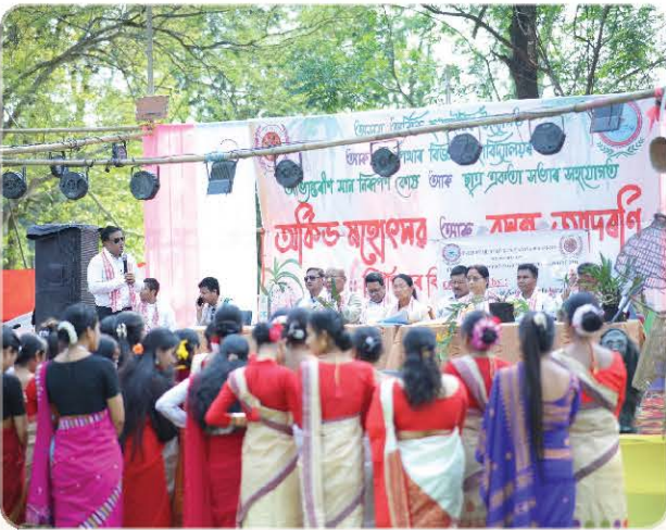
Audience moments from the festival.