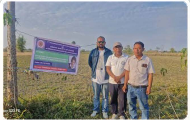
Society Members Observing Foundation Day.