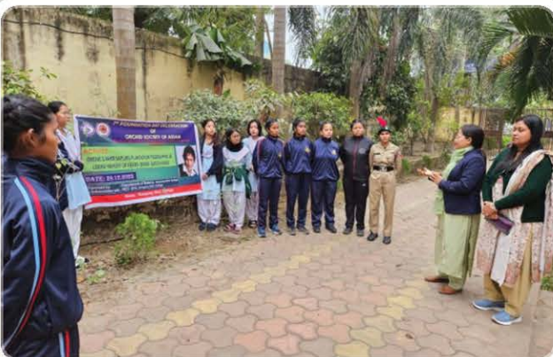
Campaign programme at Nowgong Girls' College.