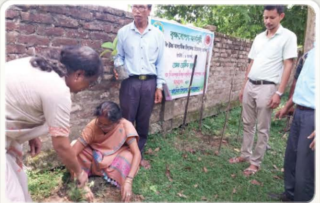
Plantation Programme by Society Members in Jorhat.