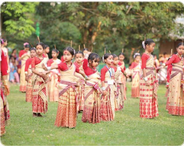
Traditional performance at the festival.