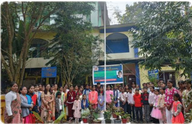
7 th Foundation Day Observed in Society Office.