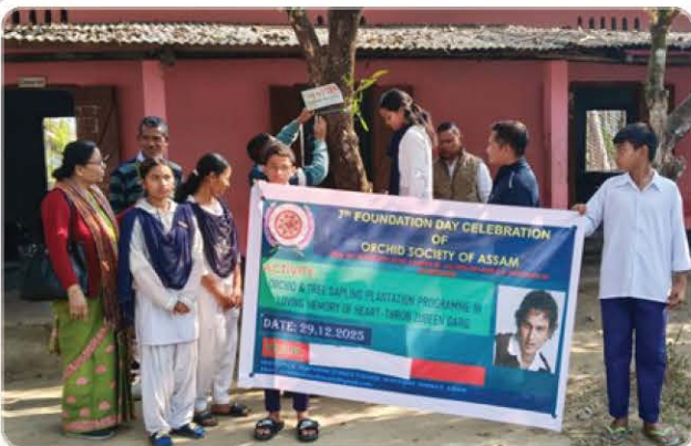
Display of the awareness programme banner.