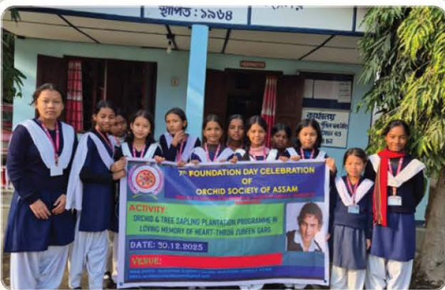
Foundation Day Celebration programme.