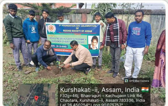
Orchid Plantation in Kokrajhar.

Kurshakati-ii, Assam, India F32g+46j, Bhaoraguri - Kachugaon Link Rd, Chautara, Kurshakati-ii, Assam 783336, India Lat 26.450254° Long 90.07575°