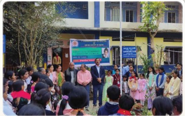
7 th Foundation Day Observed in Society Office.